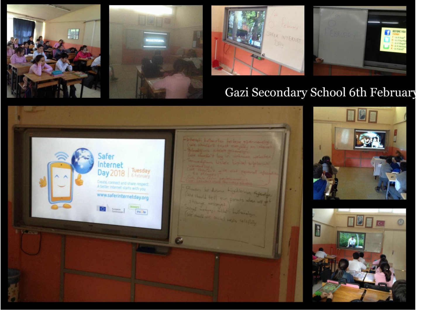
Gazi Secondary School 6th February

6 Şubat GÜVENLİ İNTERNET konusunda öğrencilerimizi bilgilendirdik.